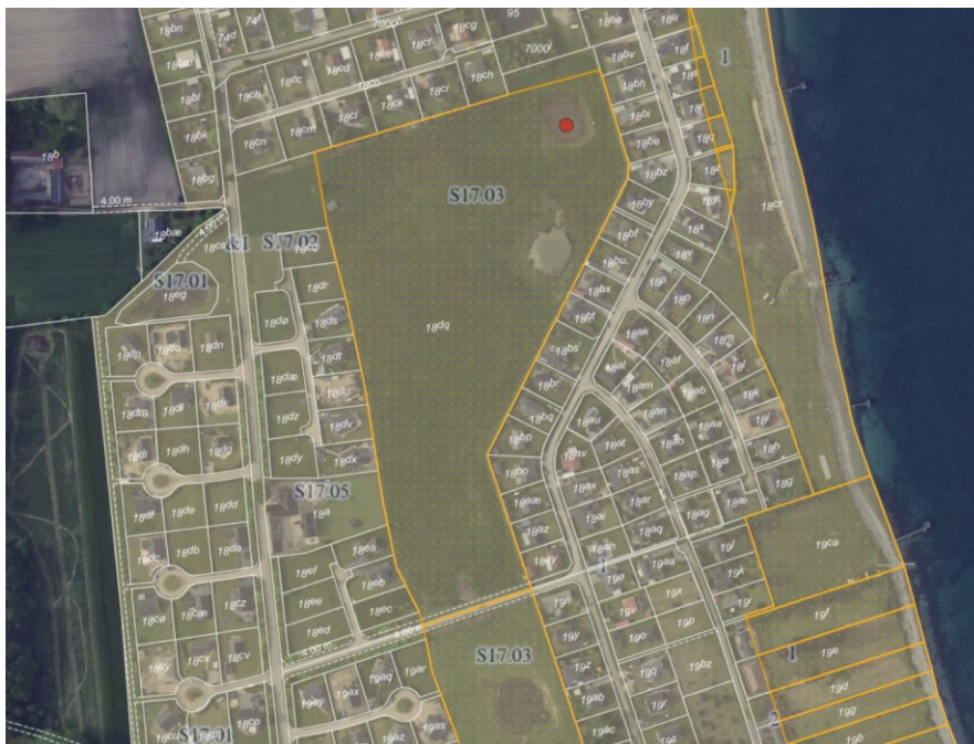
Fig. 1. Ortofoto 2022. Den røde punkt markerer det ansøgte vandhul. Det orange prikkede område markerer det strandbeskyttede areal. De hvide streger markerer de vejledende matrikelskel.

Området er udlagt som sommerhusområde ved lokalplan: S 17.01.01, Sommerhusområde ved Maemosevej, Tårup Strand. Lokalplanens formål er bl.a. at sikre klokkefrøers og stor vandsalamanders trivsel på området. Søen ligger i lokalplanens delområde S17.03, som har status som landzone og skal anvendes som naturareal. Naturarealet er omgivet af bebyggelse. (se figur 1)