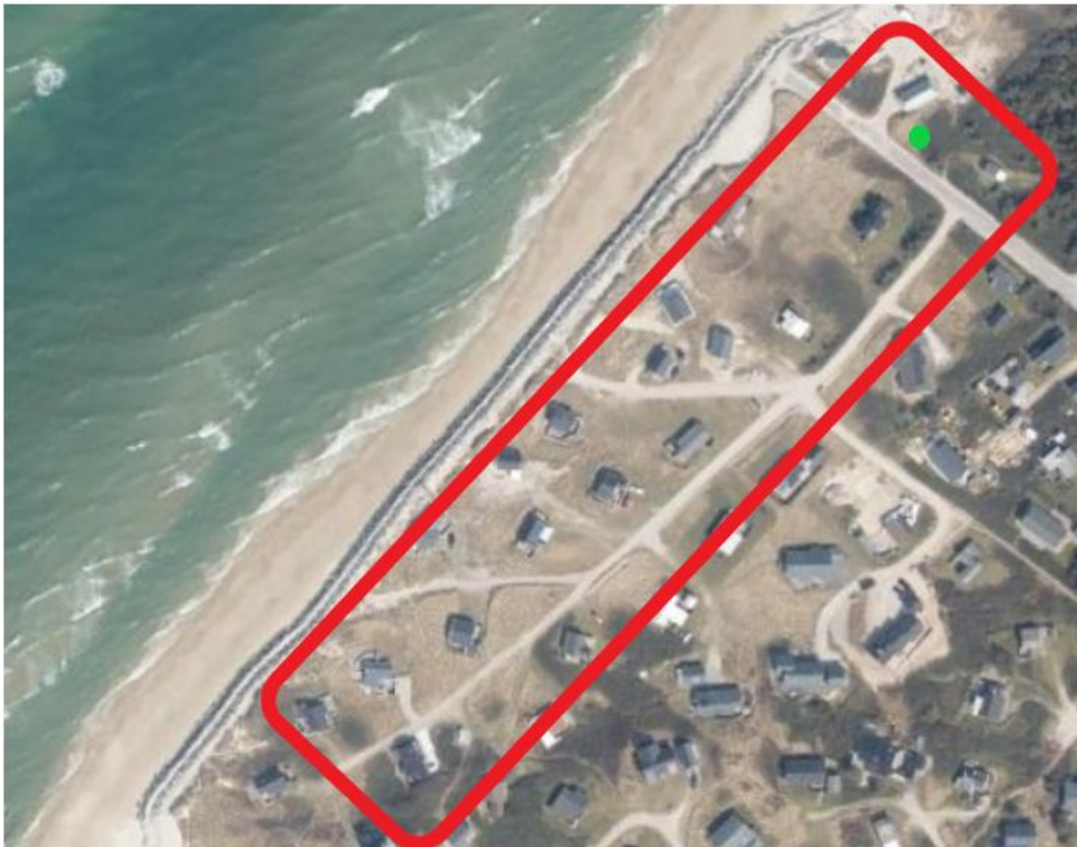
Fig. 2 viser luftfoto 2021 over området med en cirka markering af det område som bliver berørt af projektet (rød firkant) samt placeringen af pumpestationen (grøn prik) i øverste højre hjørne af billedet.