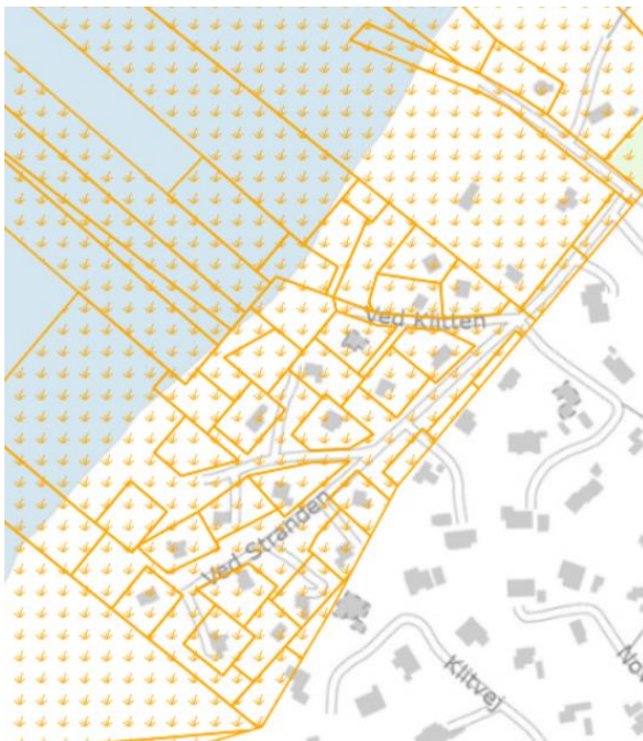
Fig. 1 viser et kort over området, hvor det klitbeskyttede areal ses.

Pumpestationen vil være det eneste synlige anlæg i projektet og vil have følgende mål: Længde: ca. 2,75m, Bredde: ca. 1,90m, Højde: ca. 2,90m