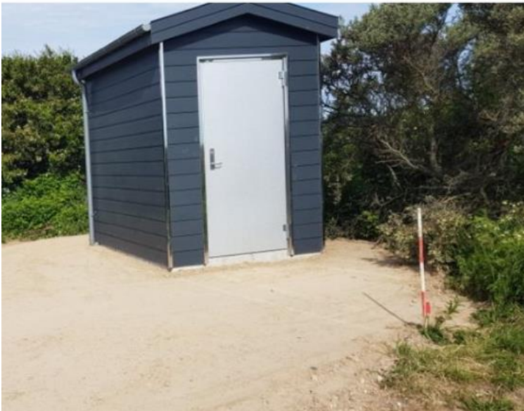
Fig. 4 medsendt billede af en lignende pumpestation.