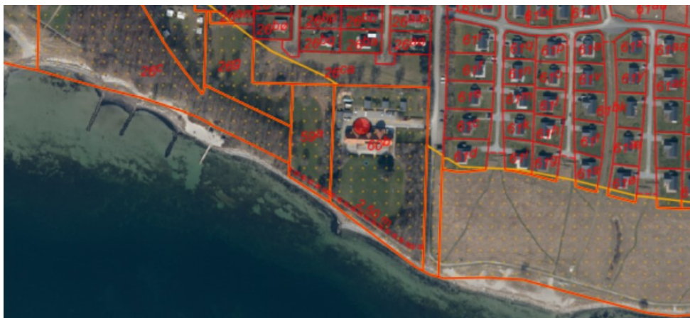
Figur 1. Ortofoto 2021. Det orange skraverede område markerer det strandbeskyttede areal. De røde og orange streger markerer de vejledende matrikelskel. Ejendommen er markeret med en rød prik.

Ejendommen matr. nr. 60b, Nysted Markjorder er beliggende på Rødsandsrevle 2, 4880 Nysted, i Guldborgsund Kommune. Ejendommen er i BBR noteret som ”anden kommunal ejendom”, ligger i landzone og indenfor den udvidede del af strandbeskyttelseslinjen.