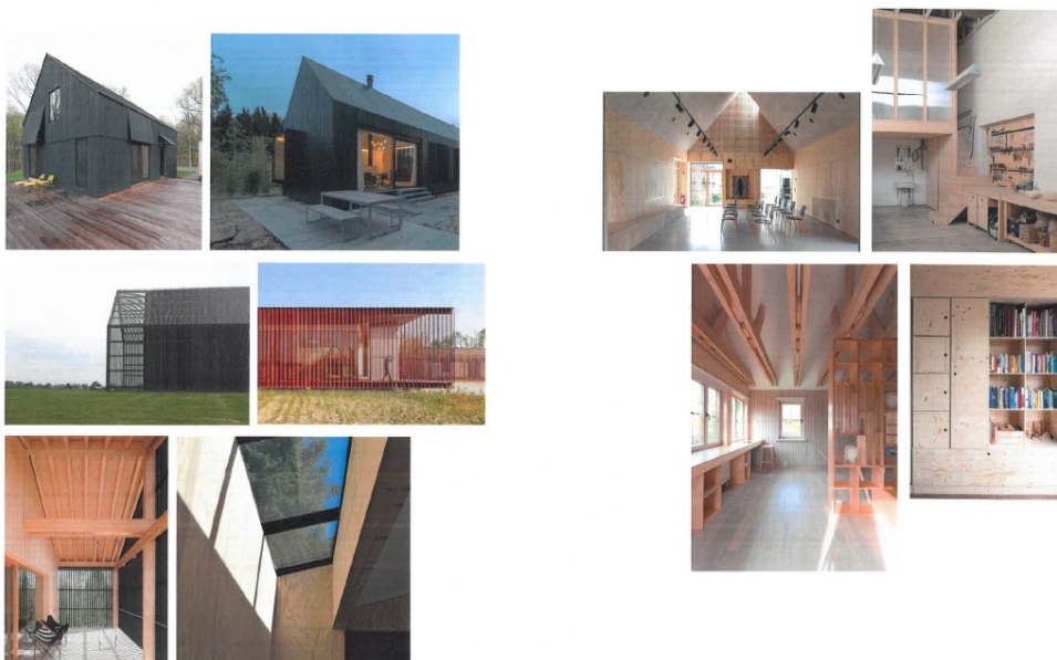
Figur 3, billeder af princip for det ansøgte byggeri, fra ansøgningen