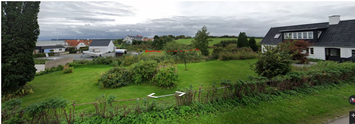
Indtegning af Kystdirektoratet vedr. placeringen (fra Street-view)