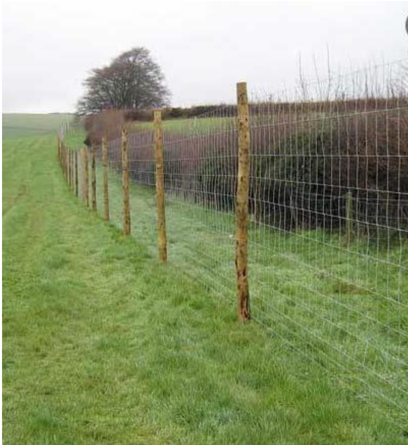
Hegn af samme type som ønskes opsat.

Hegnet ønskes opsat som et 160 cm. højt vildthejn og vil blive sat i en afstand af ca. en meter fra et eksisterende beplantningsbælte.