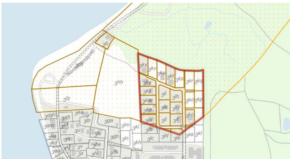
Figur 1. Kortudsnit. Den røde markering viser arealet, hvor strandbeskyttelseslinjen ønskes ophævet. Den orange prikkede signatur viser de strandbeskyttede arealer (umatrikulerede arealer ud til kysten er dog også omfattet af strandbeskyttelseslinjen). De grå streger markerer de vejledende matrikelskel.

Arealet er omfattet af lokalplan 2.07 for nordvestlige Lohals, og beliggende inden for lokalplanens delområde 4. Lokalplanen blev endelig vedtaget den 11. oktober 1999.