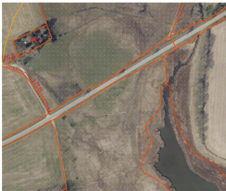
Fig. 1. Ortofoto 2021. Det orange skraverede område markerer det strandbeskyttede areal. De røde streger markerer de vejledende matrikelskel.

Til etablering af røroverkørslen, vil der blive anvendt et rør med samme diameter som drænet der leder til grøften, nemlig en diameter på 100 mm, og røret lægges ikke dybere end eksisterende bundkote i grøften. Grøften er ca. 4 meter bred, og røroverkørslen bliver derfor i alt ca. 4 m bred og ca. 6 meter lang. Oven på røret udlægges der stabilgrus.