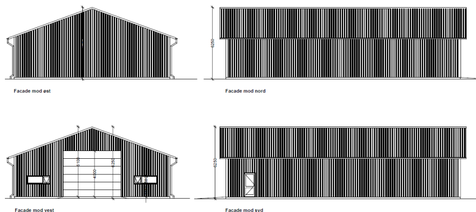
Figur 3, facadetegninger, fra ansøgningen