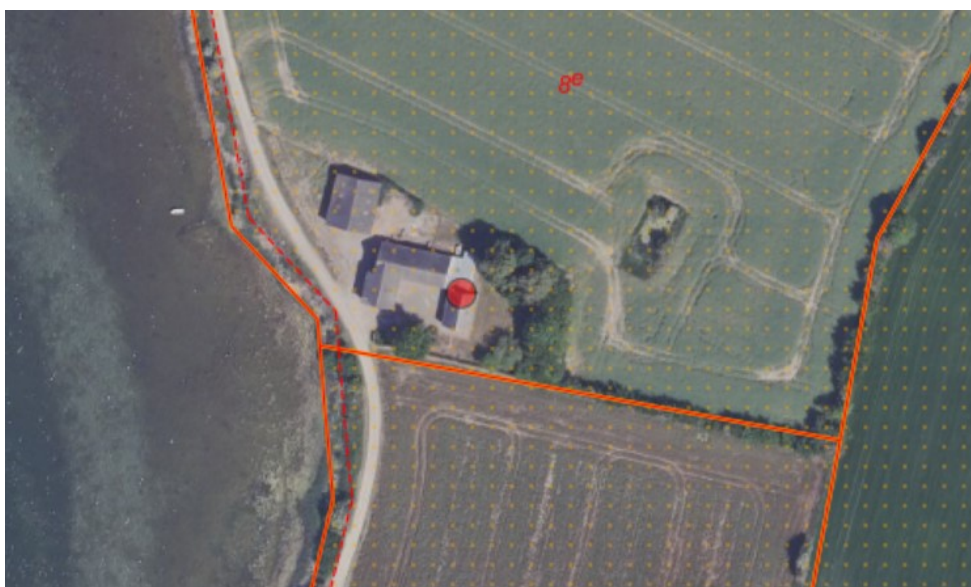
Figur 1. Ortofoto 2020. Det orange prikkede område markerer det strandbeskyttede areal. De orange streger markerer de vejledende matrikelskel.

Kystdirektoratet meddelte den 26. oktober 2021 tilladelse til opførelse af nyt stuehus og ny driftsbygning på 200 m 2 på landbrugsejendommen matr. nr. 8e, Lindelse By, Lindelse, Bogøvej 24, 5900 Rudkøbing, i Langeland Kommune. Ejendommen ligger i landzone i den oprindelige 100 m del af strandbeskyttelseslinjen, og er på omtrent 6,9 ha. Det nye stuehus og driftsbygningen erstattede eksisterende stuehus samt driftsbygninger på i alt 441 m 2 .