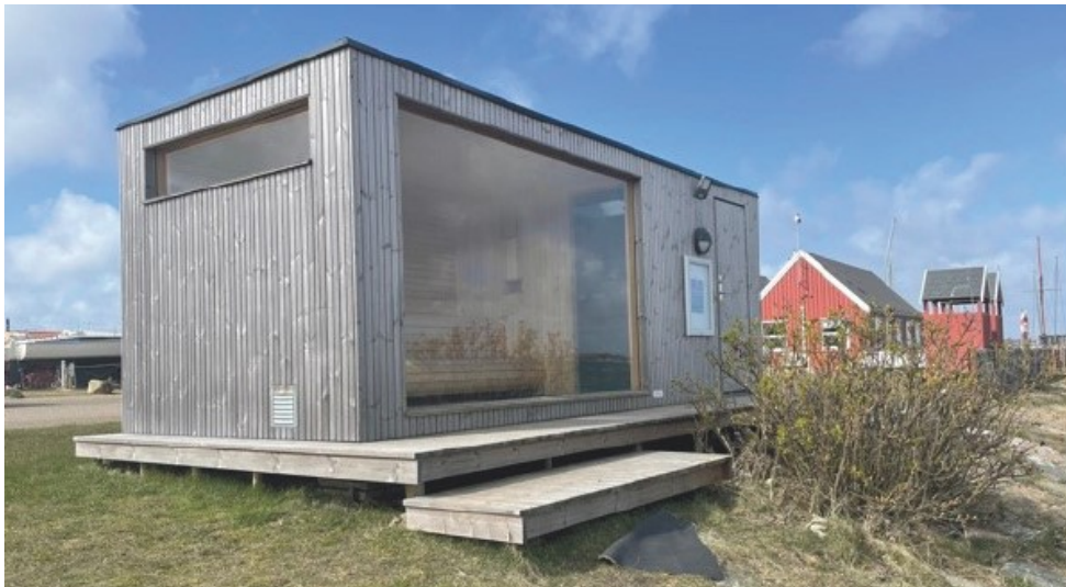
Eksempelvisning af sauna. Indsat fra ansøgningen.

Ansøger har som alternativ til det viste projekt foreslået, at projektet kan udføres uden sauna, og således kun med to shelters på samme placering som vist ovenfor.