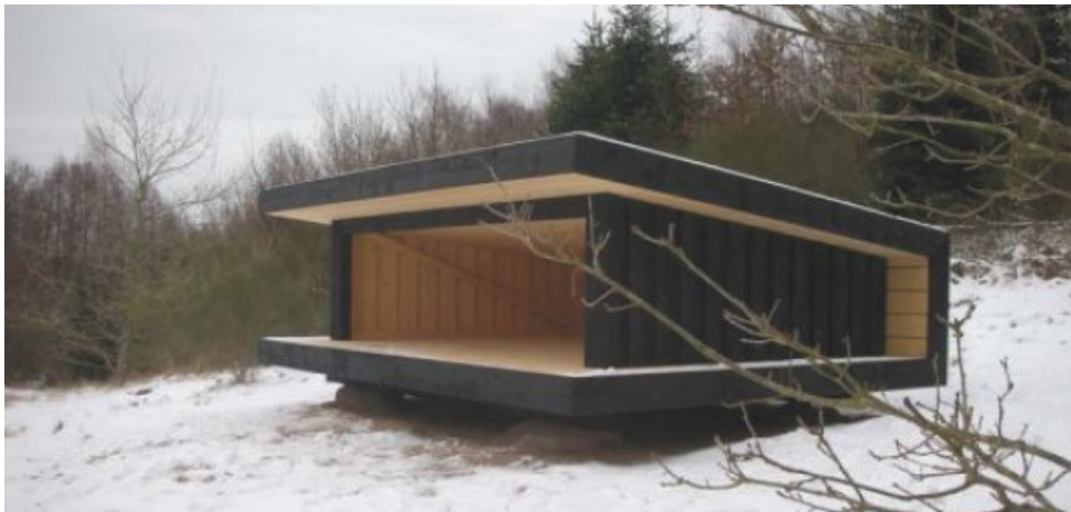
Eksempelvisning af shelter. Indsat fra ansøgningen.