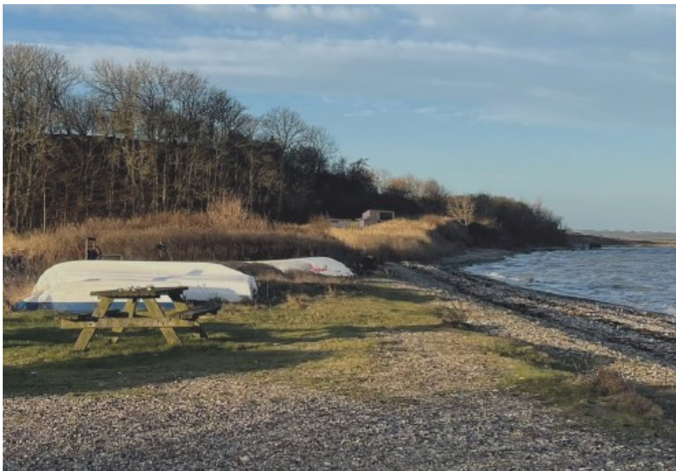
Visualisering af projektet med sauna og to shelters set fra kroen.