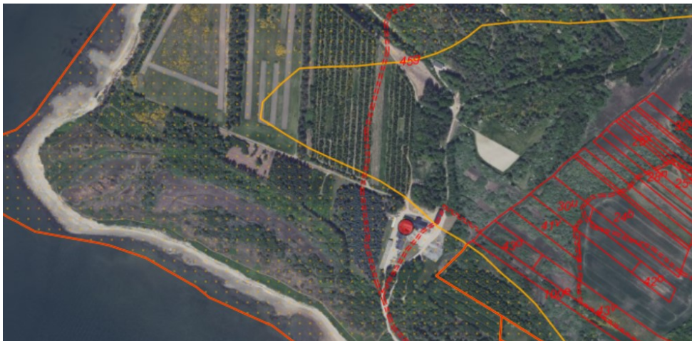
Figur 1. Ortofoto 2020. Det orange prikkede område markerer det strandbeskyttede areal. De orange og røde streger markerer de vejledende matrikelskel. Fur Bryghus er markeret med rød prik.

Ejendommen matr. nr. 45g, Fur Præstegaard, Fur er beliggende på Knudevej 3, Fur i Skive Kommune. Ejendommen er på omtrent 122,5 ha, beliggende i landzone og består af en blanding af skov, frijord og naturarealer, hvor bebyggelsen på Knudevej 3 rummer Fur Bryghus og en driftsbygning knyttet til arealerne. Bygningerne ligger i den udvidede strandbeskyttelseslinje, der i Viborg Amt trådte i kraft den 3. april 2003.