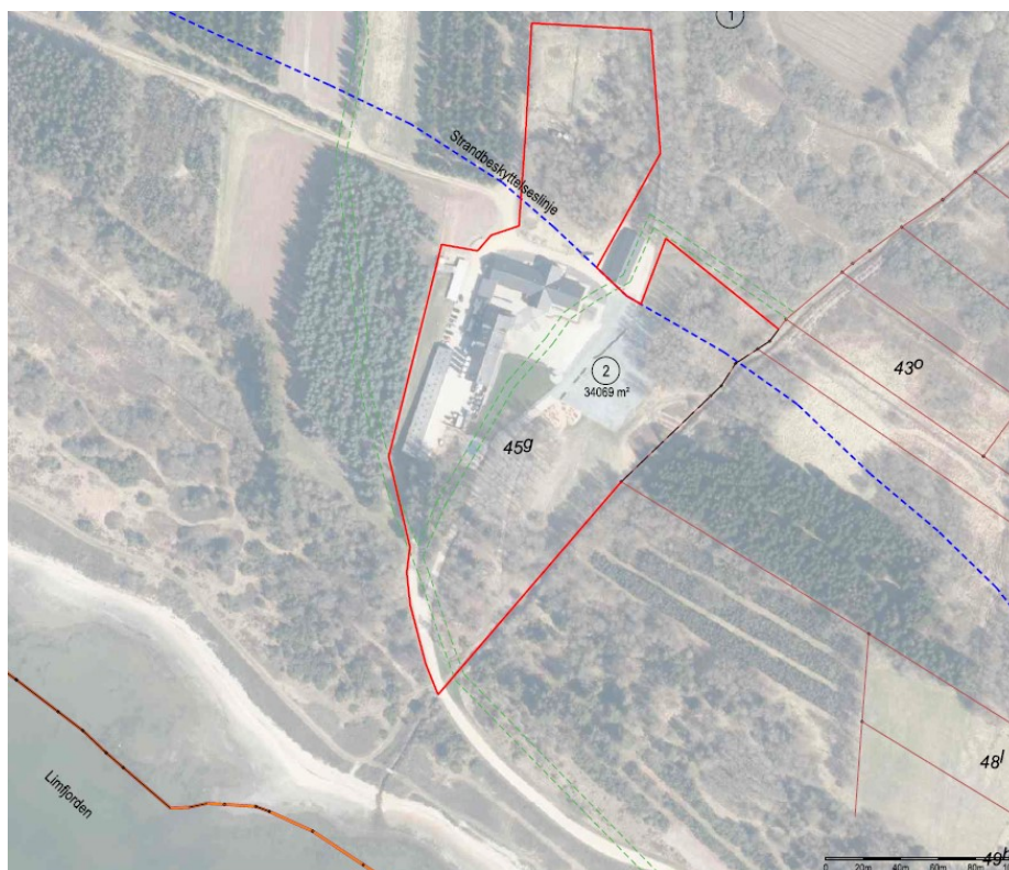
Figur 3, ændringskort fra ansøgningen

Af ansøgningen fremgår følgende om formålet med udstykningen: