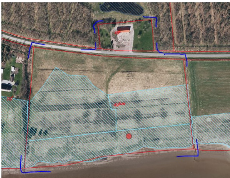
Ejendommens tilliggende afgrænset med blå – strandeng er skraveret blå