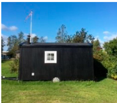
Fig. 2. Billede fra ansøgningen, der viser den mobile sauna.

Matrikel 34ac, Hesselager By, Holmskov Strand 4, Hesselager er omfattet af lokalplan nr. 11 "Sommerhusområde ved Holmskov Strand". Det ses dog ikke, at lokalplanen giver mulighed for opførelse af et nærmere bestemt antal bygninger og anlæg på den ønskede placering og der er ikke sket ændringer i lokalplanen siden Kystdirektoratets afslag den 13. oktober 2021.