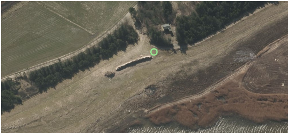
Figur 2, skråfoto 30. marts 2021 af det eksisterende sommerhus