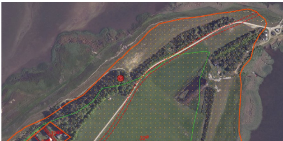
Figur 1. Ortofoto 2020. Det orange skraverede område markerer det strandbeskyttede areal. De umatrikulerede arealer ud til kysten samt stranden er dog også omfattet af bestemmelserne om strandbeskyttelse. De orange streger markerer de vejledende matrikelskel. Ejendommen er markeret med rød prik.

Ejendommen matr. nr. 32a, Sdr. Nissum Mark, Sdr. Nissum er beliggende på Nr. Fjandvej 13, Ulfborg i Holstebro Kommune. Sommerhuset ligger omtrent 100 m fra kysten i landzone og indenfor den oprindelige 100 m strandbeskyttelseslinje. Sommerhuset ligger på lejet grund.