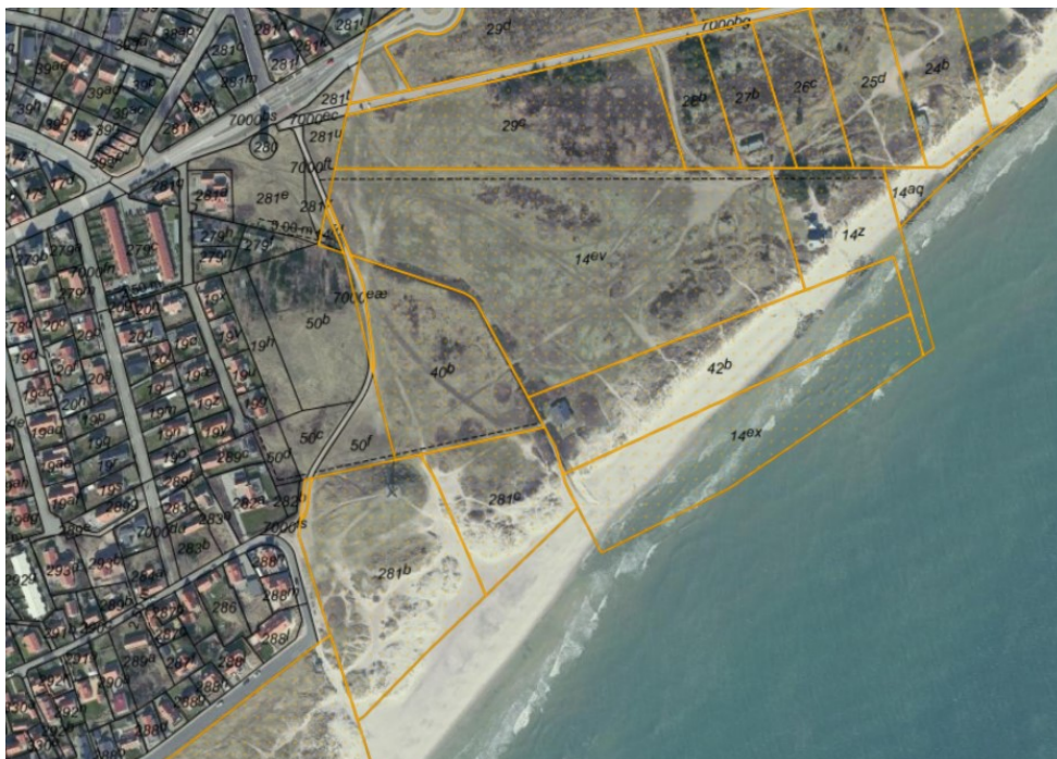
Luftfoto af området indsat fra SagsGIS