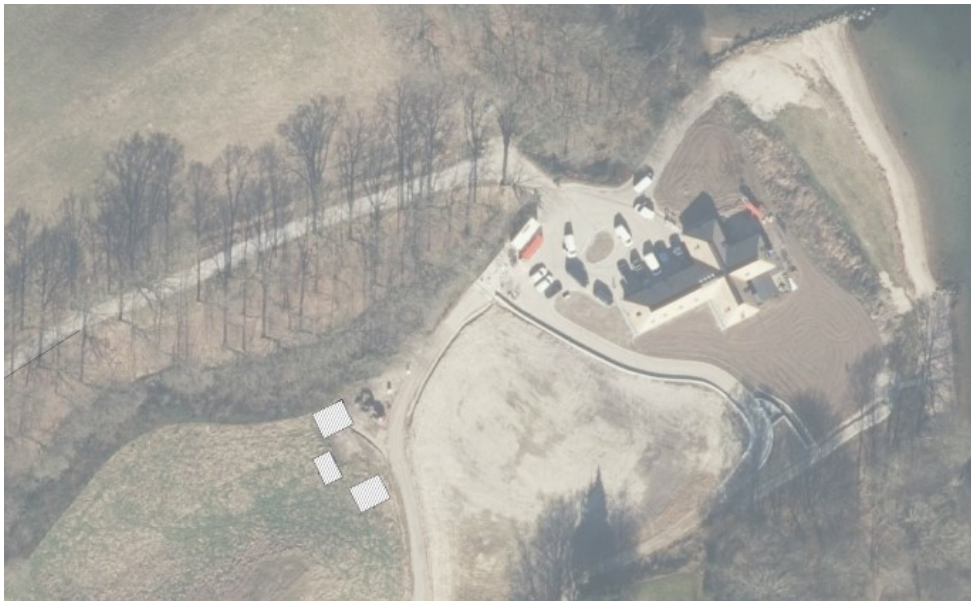
Figur 3, situationsplan på ortofoto