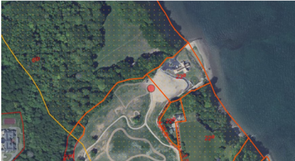
Figur 1. Ortofoto 2020. Det orange prikkede område markerer det strandbeskyttede areal. De orange streger markerer de vejledende matrikelskel.

Ejendommen matr. nr. 8e, Gauerslund By, Gauerslund er beliggende på Trindhøjvej 99, 7080 Børkop øst for Brejning lystbådehavn, helt kystnært ned til Vejle Fjord. Ejendommen er landbrugsnoteret ligger i landzone. Boligen ligger indenfor den oprindelige 100 m strandbeskyttelseslinje, mens de ansøgte driftsbygninger skal placeres landværts boligen i den udvidede del af strandbeskyttelsen.