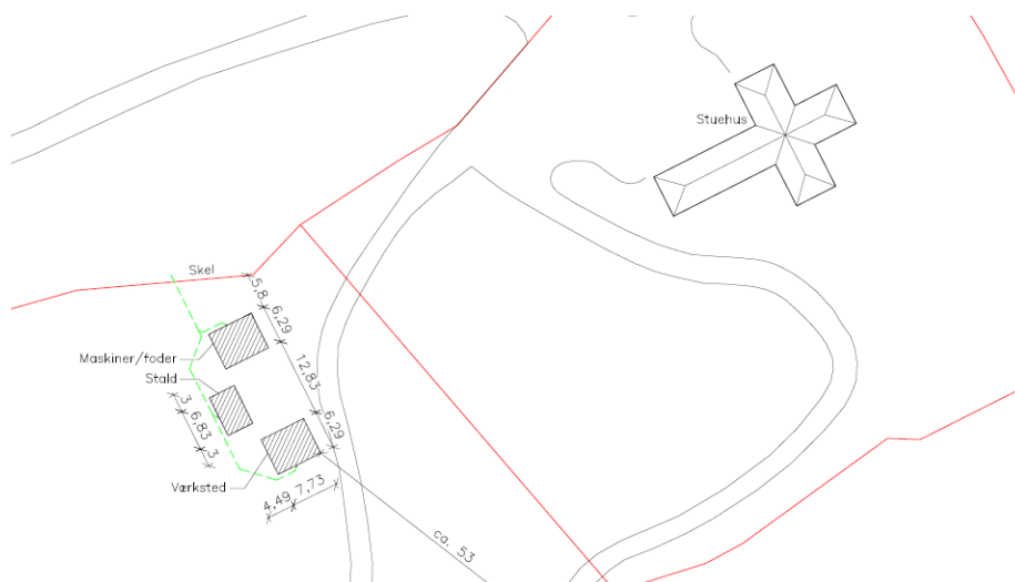
Figur 2, situationsplan fra ansøgning

Ejer har ansøgt om dispensation til at opføre yderligere driftsbygninger i form af tre mindre bygninger placeret samlet. Bygningerne er henholdsvis stald, værksted og kombineret maskinhus og lade/foderopbevaring.