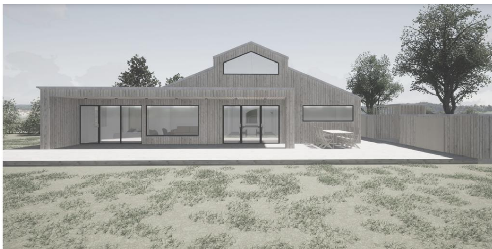
Visualisering af ansøgt hus

Vi syntes, arkitekterne er kommet godt i mål med et projekt, hvor huset fremtræder, som var det bygget af én omgang. Udhænget udgør limen mellem tilbygning og eksisterende hus, og er derfor vital for projektet. Det er dette udhæng, vi søger om dispensation for jf. lempelserne der trådte i kraft i 2017.