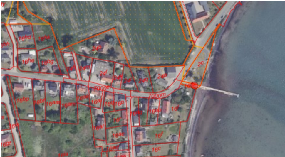
Figur 1. Ortofoto 2020. Det orange prikkede område markerer det strandbeskyttede areal. De umatrikulerede arealer ud til kysten samt stranden er dog også omfattet af bestemmelserne om strandbeskyttelse. De orange og røde streger markerer de vejledende matrikelskel. Placeringen er markeret med rød prik.

Byrum Dyreborg ansøgte den 3. juni 2021 om dispensation til arealoverførsel samt etablering af parkeringsplads med tilhørende faciliteter landværts Dyreborgvej. Ansøgningen blev den 4. juni 2021 suppleret med en ansøgning om opstilling af en sauna på arealet mod kysten, i tilknytning til eksisterende badebro på matr. nr. 161b, Bjerne By, Horne. Ejendommen er en kombineret beboelses- og forretningsjendom beliggende i landzone, helt kystnært med den gamle og nye del af Dyreborg.