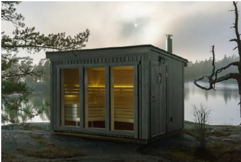
Figur 2, billede af sauna fra ansøgning