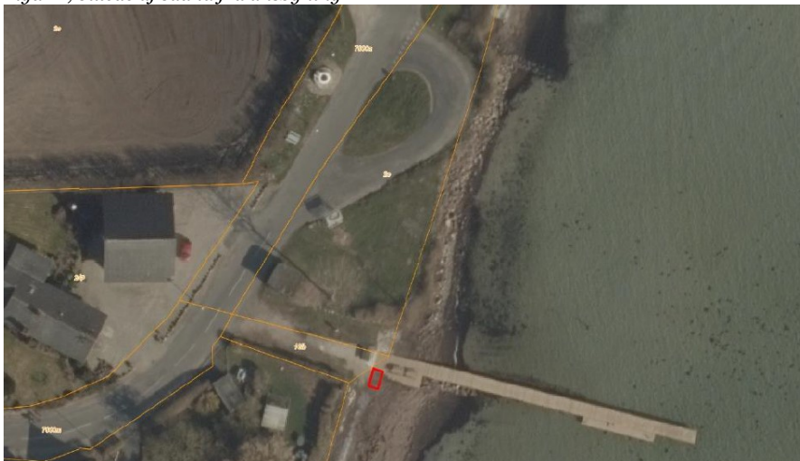
Figur 3, placering vist med rød streg, fra ansøgning