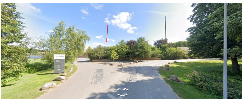
Anlægget placeres bag bevoksningen ved rød pil

Grundet Vindø Teglværks placering klos op ad fjord, fredskov og lokalplanbelagte områder er mulighederne for placering af ovenstående gastankanlæg yderst begrænsede. Faktisk er ansøgte placering eneste mulighed for at kunne overholde Beredskabsstyrelsens påkrævede afstande til både skel og bygninger, samtidig med at der skal tages højde for muligheden for at skyde gasrør frem til eksisterende installationer uden at skulle under bygninger. Placeringen er desuden bekvem for tilkørende tankvogn og da al eksisterende beplantning bevares, er den landskabelige konsekvens minimal.