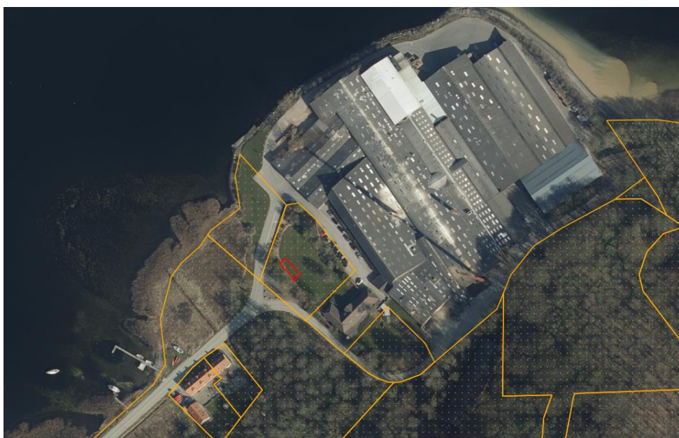
Anlægget placeres ved rød markering- der etableres udvidelse af den eksisterende parkering mellem tank og bebyggelsen

Kystdirektoratet har i januar 2022 dispenseret til udvidelse af en parkeringsplads og anlægget placeres umiddelbart vest for denne. Teglværket er placeret i skovbygelinje i et noteret værdifuldt landskab.