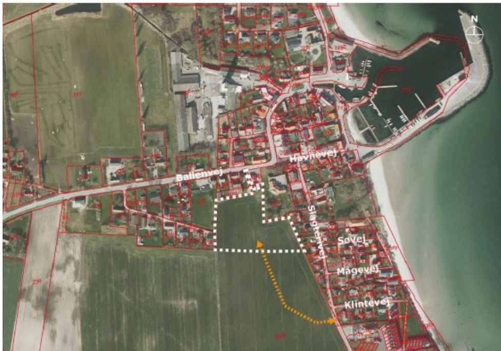
Figur 2. Kortudsnit fra ansøgningen: ”Luftfoto med markering af forslag til afgrænsning af lokalplanområdet (hvid, stiplet afgrænsning) og forventet fremtidig vejbetjening vist med principiel placering, som ligeledes ønskes at indgå i lokalplanområdet (orange pil)”.