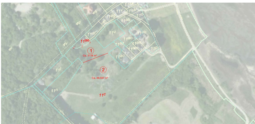
Udstykningsplan. Delområde 1 overføres til matr. 11ae mens delområde 2 udgør resten af matr. 11c.