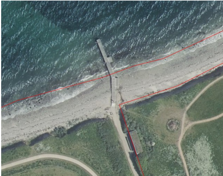
Fig. 1. Ortofoto 2020. De røde streger markerer de vejledende matrikelskel. Den eksisterende badebro med rampe henover stranden erstattes af det ansøgte projekt.

Landrepossen får en størrelse på 8 m* 6 m, og det udføres som en træterrasse uden gelænder og tilpasset terrænet for at tillade fri passage langs stranden.