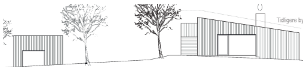
Facaden mod vandet i ny ansøgning (bygning til venstre det tilbagetrukne anneks)