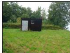
Byg. 1 - Træskur som bruges til opbevaringsdepot

Ejendommen er en sommerhusejendom med et jordtilliggende på 2998 m 2 . Bebyggelsen på ejendommen består af sommerhusene Nr. 194- 34 m 2 opført 1970, Nr. 196 - 63 m 2 opført 1937, Nr. 198 - 41 m 2 opført 1969 og Nr. 200 - 55 m 2 opført 1969. Herudover er der 2 udhuse på ejendommen: bygning 5 på 9 m 2 og bygning 6 på 10 m 2 . Ejendommen indeholder således i alt 193 m 2 boligareal og 19 m 2 udhuse.