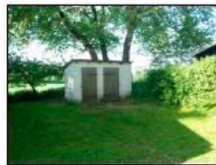
Byg. 5 - Skur som bruges til opbevaringsdepot