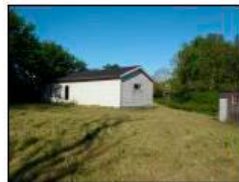
Byg. 2 - sommerhus på 55 m 2 med kphøjde på 450 cm over terræn.