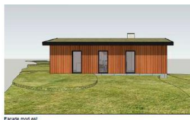
Facade mod øst