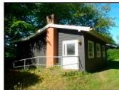
Byg. 3 - sommerhus på 41 m 2 med kphøjde på 450 cm over terræn.