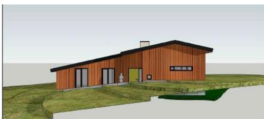
Sydfacade i gældende dispensation