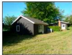
Byg. 4 - sommerhus på 63 m 2 med kphøjde på 420 cm over terræn.