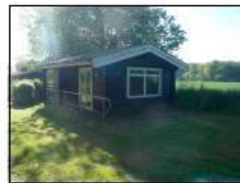
Byg. 6 - Sommerhus på 34 m 2 med kphøjde på 400 cm over terræn.