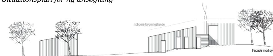
Facaden mod syd i ny ansøgning