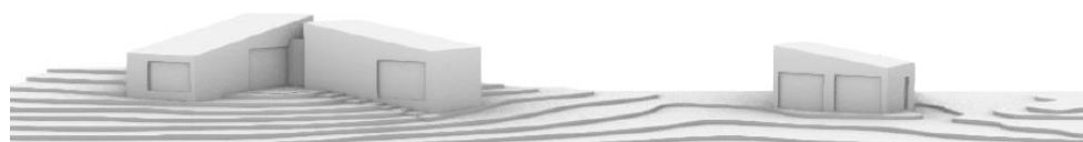
Terrænmodel af ny ansøgning set fra nord ..og fra nordøst under