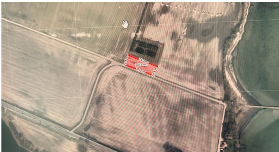
Figur 2, tegning af det pågældende areal fra henvendelsen.

Kommunen har oplyst, at det pågældende areal er det mest hensigtsmæssige i forhold til deponering, den videre anvendelse samt driften af landbrugsjorden i arbejdsperioden.