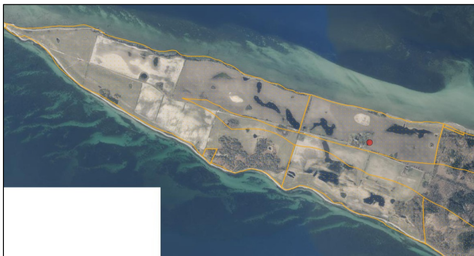
Luftfoto af Knudshoved Odde. Parkeringspladsen ønskes placeret ved den røde prik. Strandbeskyttelseslinjen er sat ind med gul. Det ses at en kile midt på Odde syd for vejen, der fører hen til boligen på ejendommen, ikke er strandbeskyttet.

Kystdirektoratet har bedt ansøger om at uddybe begrundelsen for placering af parkeringspladsen – særligt henset til, at det synes at være muligt at placere parkeringspladsen syd for den grusvej, der fører hen til og forbi boligen på ejendommen, og dermed uden for strandbeskyttelseslinjen.