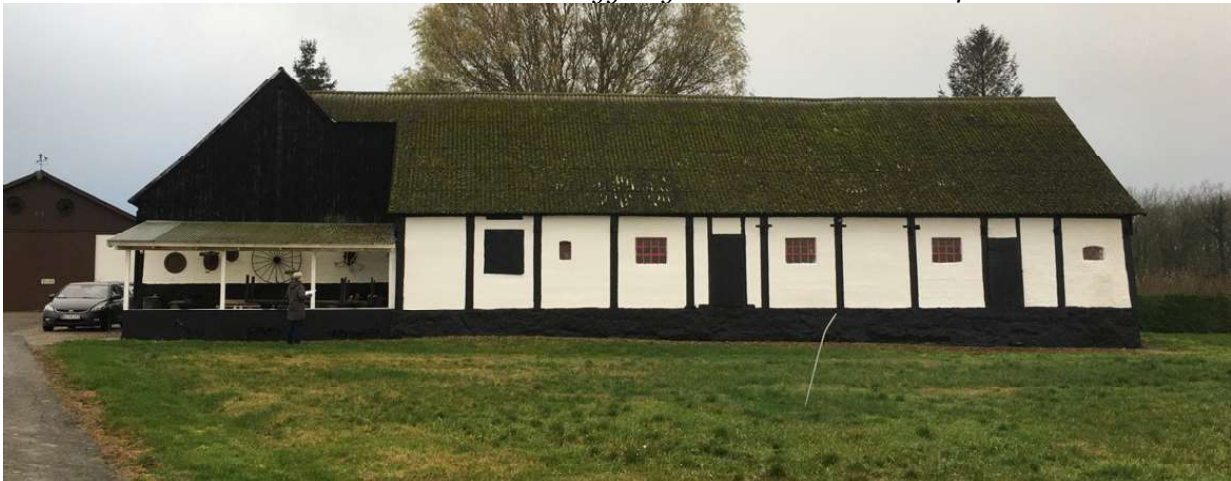
Medsendt foto af den driftsbygning som beboelsen udvides ud i. Udvidelsen sker i den højre del af bygningen.