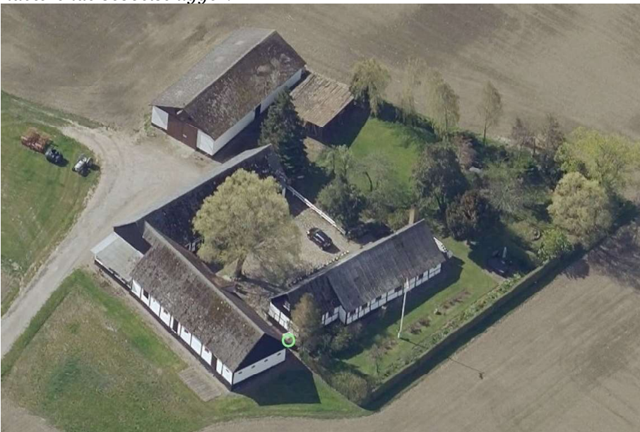
2021, skråfoto af fra nordvest. Den nuværende beboelse ses i længen til højre for den grønne plet – ved den grønne plet sammenbygges de to bygninger, og beboelsen udvides ud i den tidligere driftsbygning