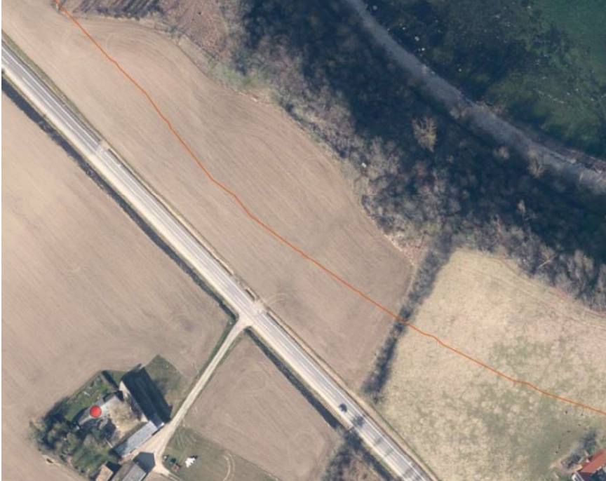
Ortofoto 2021. Den orange linje markerer den oprindelige strandbeskyttelseslinje. Den røde prik er placeret i bygningen, hvor den nuværende beboelse ligger.

Sagen vedrører udvidelse af en helårsbeboelse, som ligger inden for den udvidede strandbeskyttelseslinje. Den nuværende beboelse er på 160 m 2 , men ønskes udvidet til 250 m 2 . Udvidelsen vil ske i de tidligere landbrugsbygninger, således at beboelsen fortsat vil være én samlet enhed.