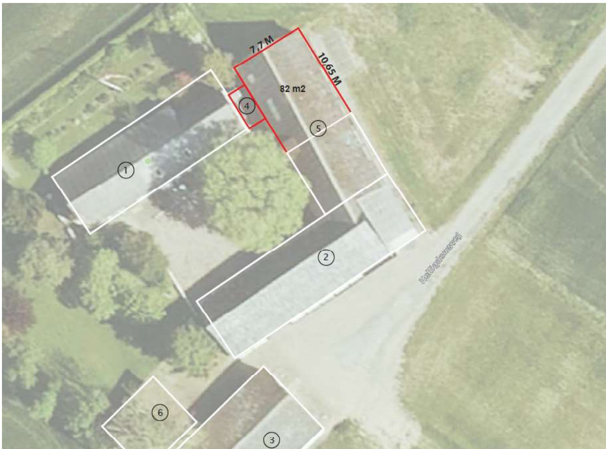
Medsendt skitsetegning af udvidelsen. Den nuværende beboelse ligger i bygning 1 – udvidelsen er markeret med 82 m2 – sammenbygningen er skitseret med nr. 4.