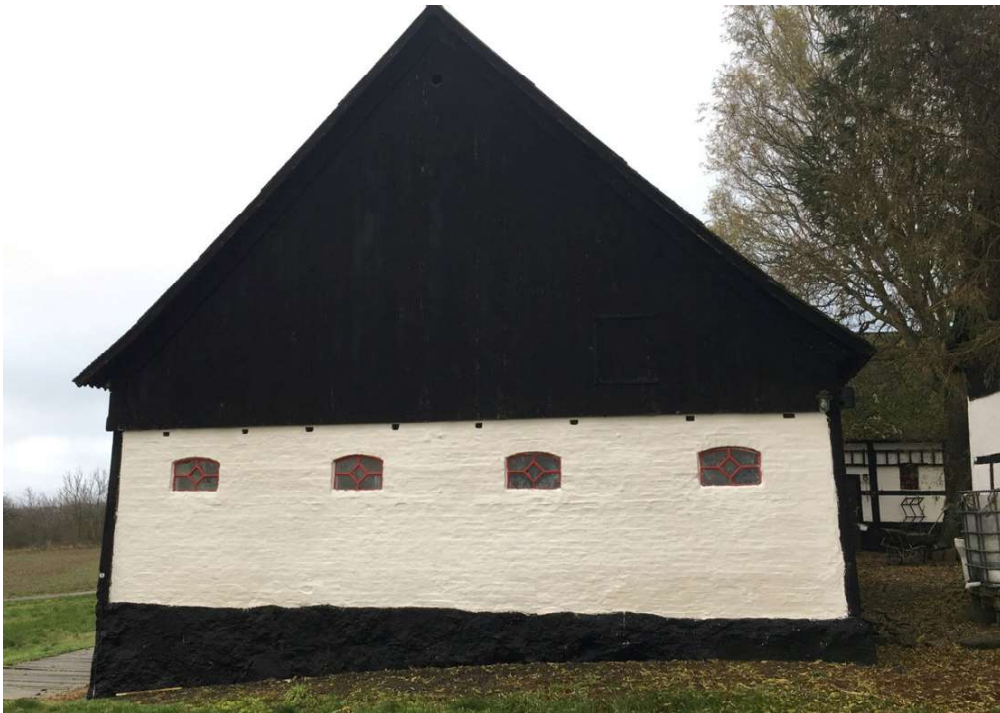
Medsendt foto af gavlen på den driftsbygning, som beboelsen udvides ud i