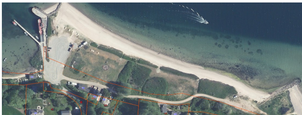
Fig. 1. Ortofoto 2020, sommer. Det orange prikkede område markerer det strandbeskyttede areal. De umatrikulerede arealer ud til kysten samt stranden er dog også omfattet af bestemmelserne om strandbeskyttelse. De røde streger markerer de vejledende matrikelskel.

Aabenraa Kommune har ansøgt om dispensation til at opsætte tre campingforbudsskilte på en ca. 200 meter lang strækning langs strandområdet Barsø Landing, der er strandbeskyttet.