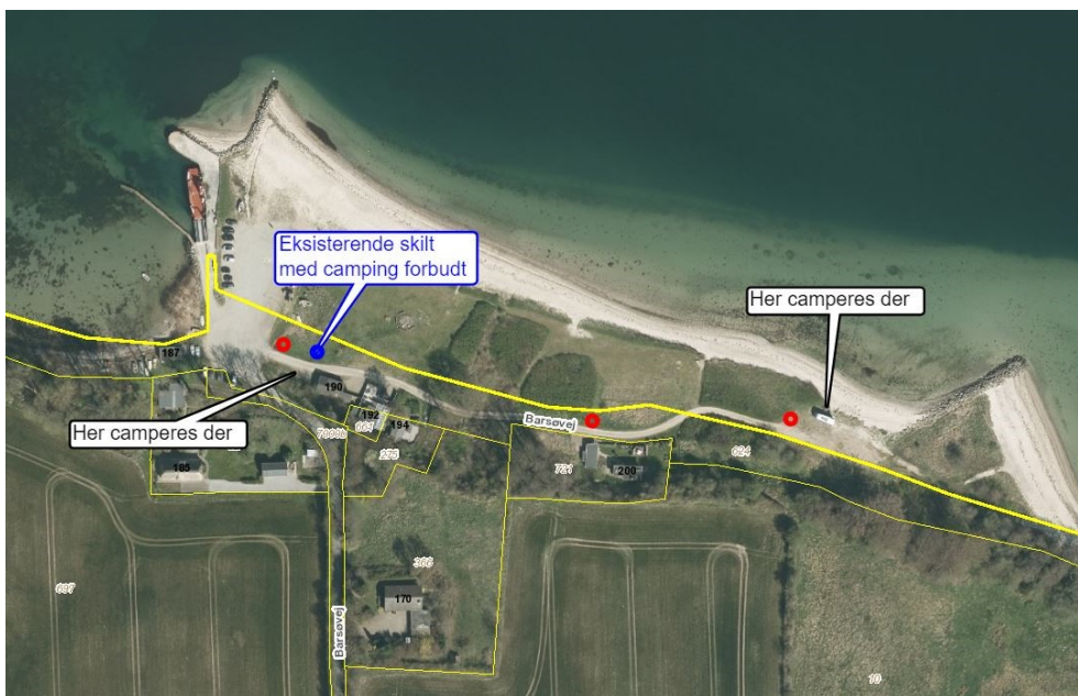
Fig. 4. Tilsendt fra ansøger, hvorpå det eksisterende skilt er indtegnet med blå, og den ønskede placering af de nye skilte er indtegnet med rød.

Kommunen ønsker med to yderligere skilte at synliggøre at camping ikke må finde sted i området. Den ønskede placering af de tre nye skilte, og placeringen af det eksisterende skilt, fremgår på fig. 4.