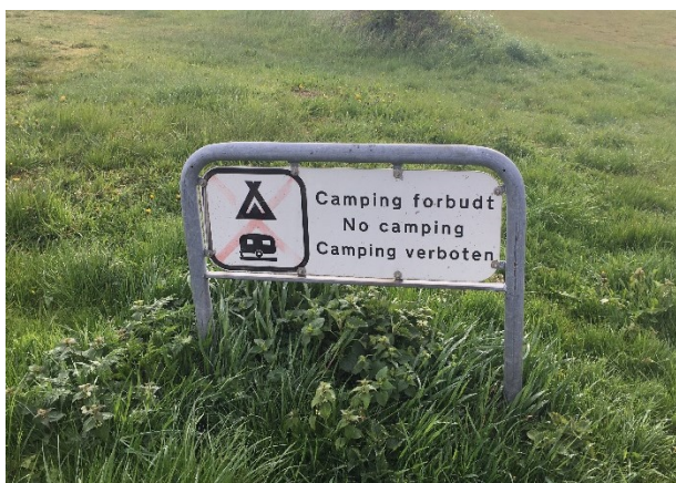
Fig. 2. foto af eksisterende campingforbudsskilt tilsendt fra ansøger.

Kommunen begrundes ansøgningen med, at de har problemer med at turister camperer på strandområdet. Kommunen oplyser at der allerede står et ældre, falmet campingforbudsskilt, som de ønsker at erstatte med et nyt opdateret skilt, hvorpå der også fremgår en autocamper. I den forbindelse vil de gerne flytte placeringen af skiltet, så det kommer tættere på vejen hvor folk kører ned til området.