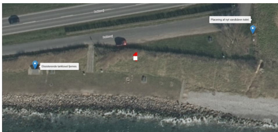
Fig. 2. Fremsendt oversigt over området.

Der er fremsendt nedenstående kort over arealet, hvoraf placeringen af de eksisterende tørkloset fremgår. Tørkloset fjernes med henblik på etablering af nyt vandbåren toilet, se fig. 2.