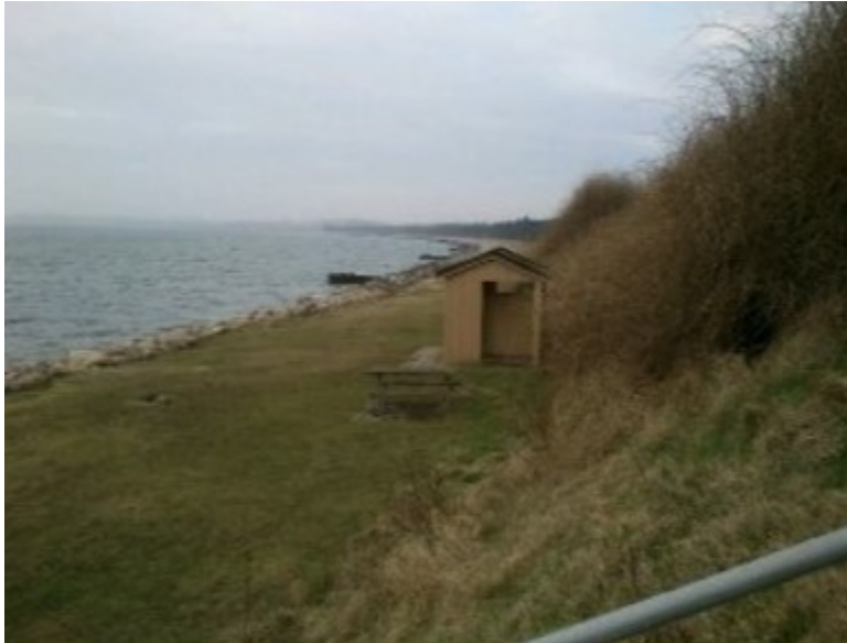
Fig. 3. Fremsendt billedet af det gamle tørkloset.

Der er fremsendt nedenstående billede af det eksisterende tørkloset, der fjernes i forbindelse med etablering af den nye toiletbygning, se fig. 3.