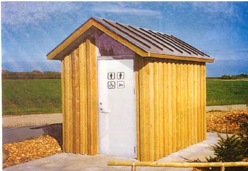
Fig. 4. Fremsendt billedet af ny toiletbygning.

Det gamle tørkloset ligger neden for en skrænt, tæt på vandet. Der er trappenedgang fra rasteplass til tørkloset.