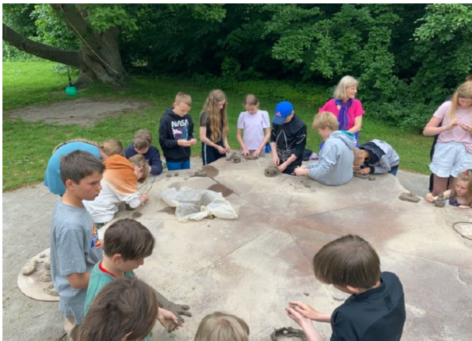
Foto af undervisningssituation. Indsendt af ansøger.