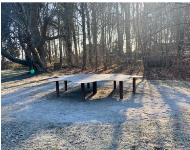
Stenmel og bord fotograferet fra terræn.