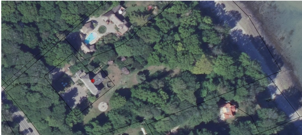
Luftfoto af området. Munkeruphus er markeret med en rød prik. Cirklen af stenmel ses syd herfor.