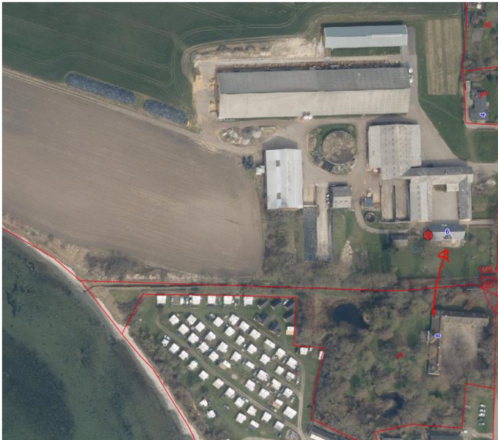
Ejendommen – stuehuset ved rød pil