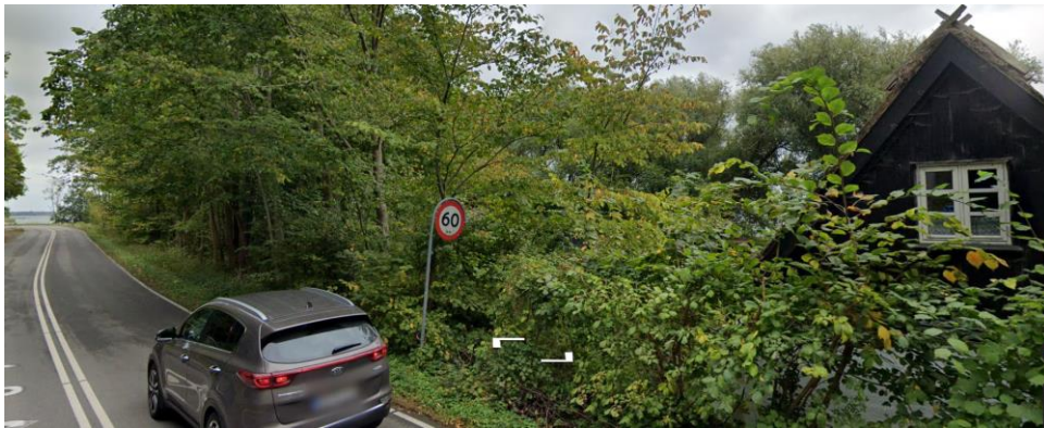
Milen placeres fra "vejskilt" og parallelt med og ca.7- 10 m fra vejen