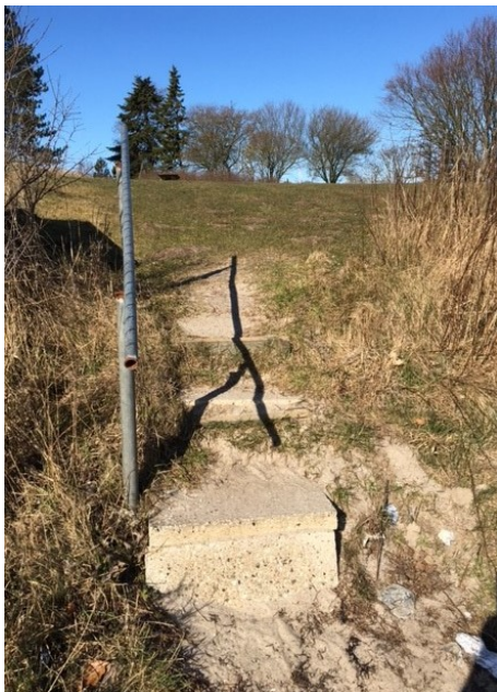
Fig. 2. Foto af den eksisterende trappe.

Ansøger ønsker at fjerne en eksisterende trappe med en nyere, der kan give en mere bekvem og sikker adgang for gangbesværede til en eksisterende badebro, der er opsat lige ud for trappen.