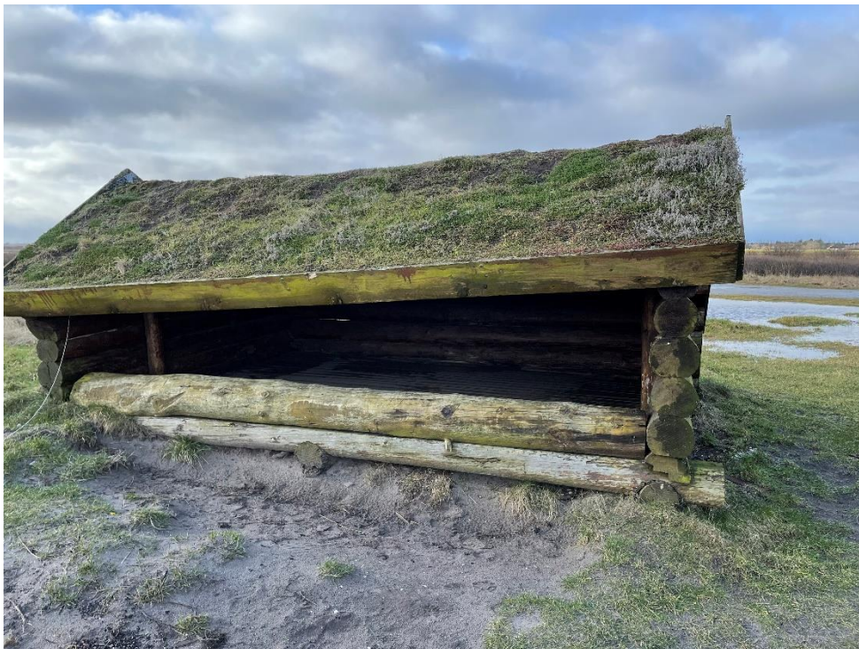
Figur 2: Billede af nuværende shelter.