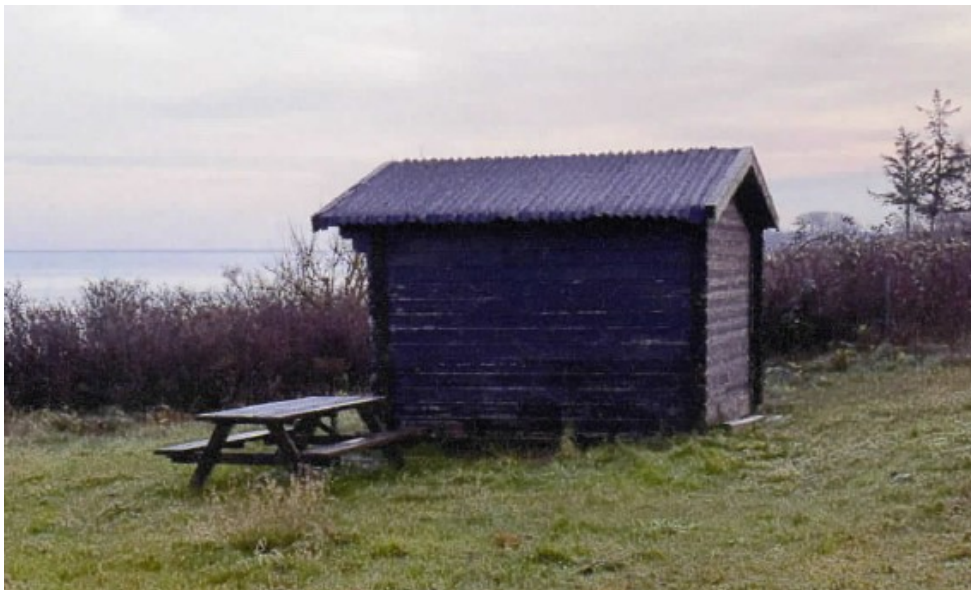
Foto af det eksisterende badehus fra nord.

Det eksisterende badehus er 9 kvm og udført med lukkede facader uden vinduer og døre mod nord, syd og vest. I facaden mod øst er en dør og et vinduet som vist på fotoet ovenfor. Det nye badehus opføres med samme dimensioner som det eksisterende og det får dør og vindue med samme placering og størrelse.