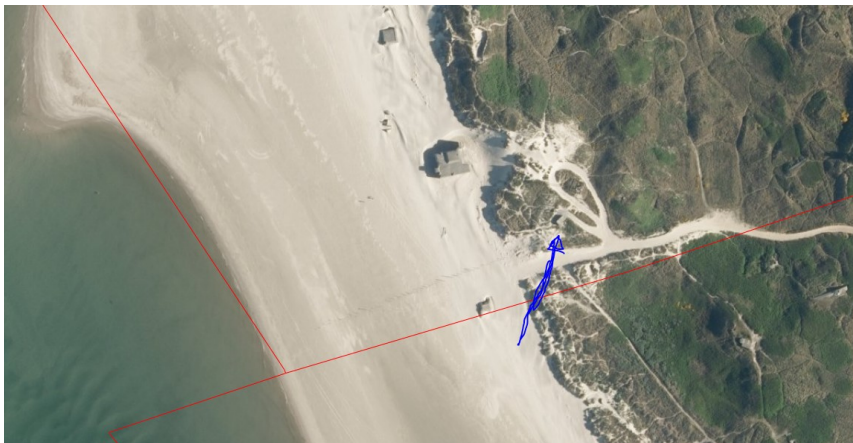
Blåvand (over) og Vejers Strand under