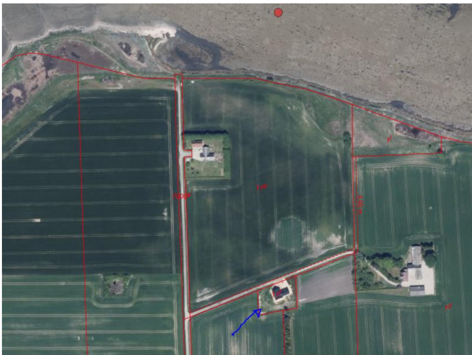
Ejendommen markeret med blå pil