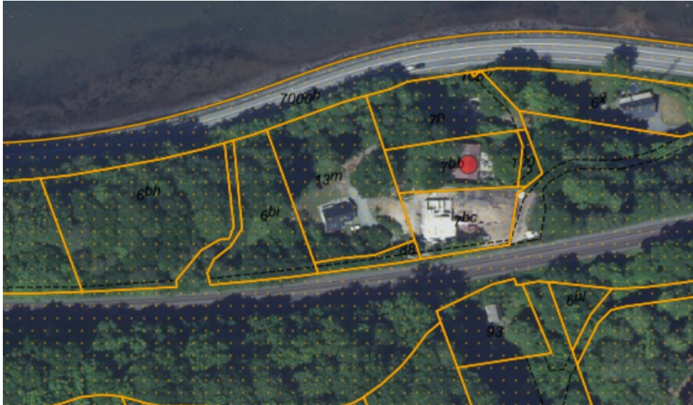
Figur 1. Ortofoto 2020. Det orange prikkede område markerer det strandbeskyttede areal. De orange streger markerer de vejledende matrikelskel. Ejendommen er markeret med rød prik.

hvoraf 9 m 2 er indbygget udhus. Ejendommen ligger indenfor den oprindelige 100 m strandbeskyttelseslinje, omtrent 55 m fra kysten.