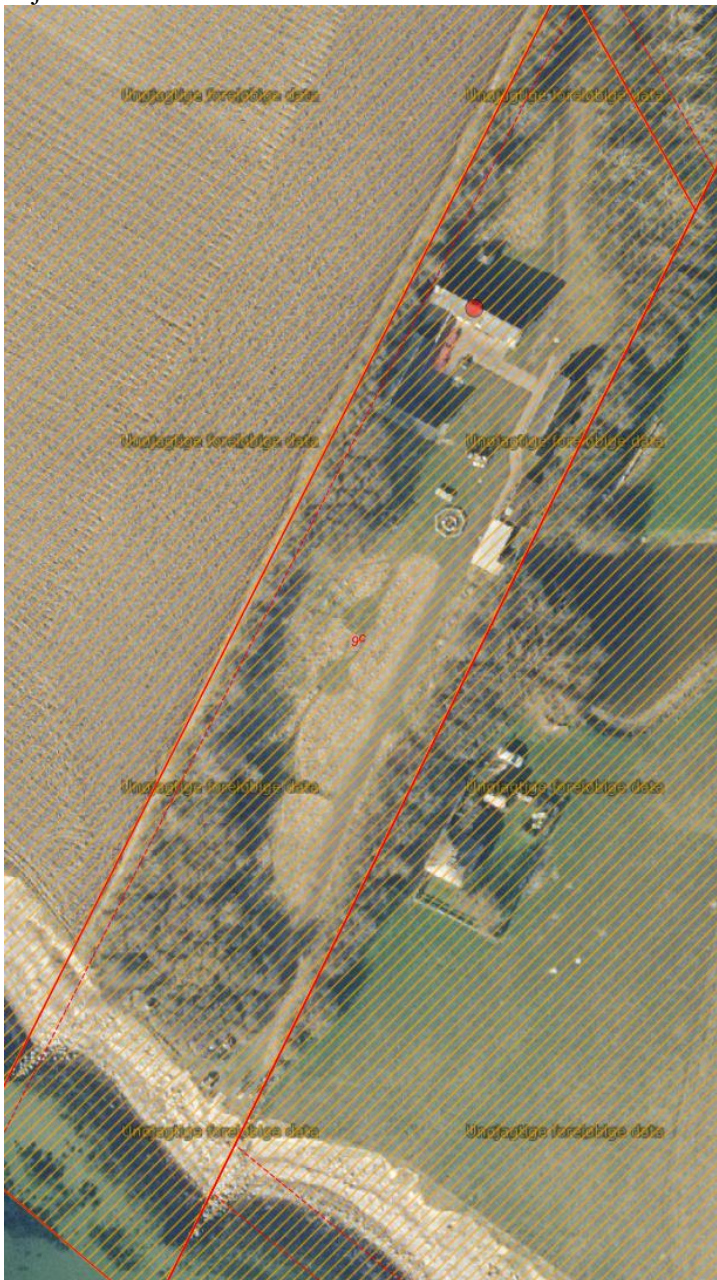
Fig. 1. Ortofoto 2021. Det orange skraverede område markerer det strandbeskyttede areal. De røde streger markerer de vejledende matrikelskel.

Der ansøges om etablering af shelter på en ejendom ved Enø. Ejendomme kaldes Enø lejren og er ejet af Næstved Kommune. Enø Lejerens Venneforeningen sørger for vedligeholdelse af ejendommen. Foreningen er ansøger vedr. shelteret. Venneforeningen har bl.a. etableret indendørs shelter med sovepladser, formidlingsrum vedr. dyr og planter mm. Enø Lejerens faciliteter er offentlige tilgængelige, og lejren har ca. 15.000 gæster årligt. Der ansøges om etablering af udendørs shelter for at understøtte friluftsliv og offentlighedens brug af Enø Lejren.