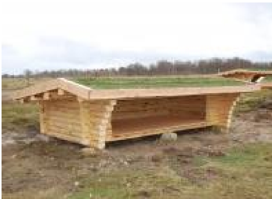
Figur 3. Indsendt af ansøger. Billede af shelterets udformning.