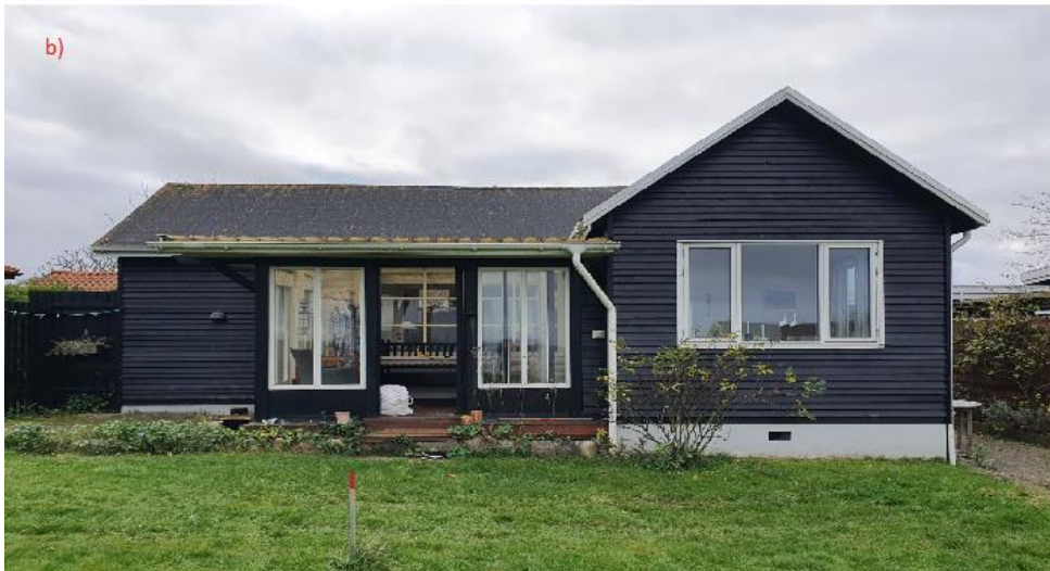
Figur 2: a) skitse af den fremtidig facade inden for strandbeskyttelseslinjen b) billede af den nuværende facade inden for strandbeskyttelseslinjen