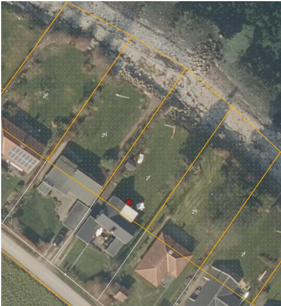
Figur 1: Ortofoto forår 2021. Det orange skraverede område markere det strandbeskyttet areal. De hvide og orange streger markere de vejledende matrikelskal.