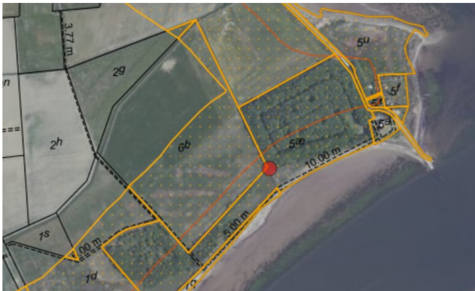
Figur 1. Ortofoto 2020. Det orange prikkede område markerer det strandbeskyttede areal. De umatrikulerede arealer ud til kysten samt stranden er dog også omfattet af bestemmelserne om strandbeskyttelse. De sorte og orange streger markerer de vejledende matrikelskel. Placeringen af shelteret er vist med rød prik.