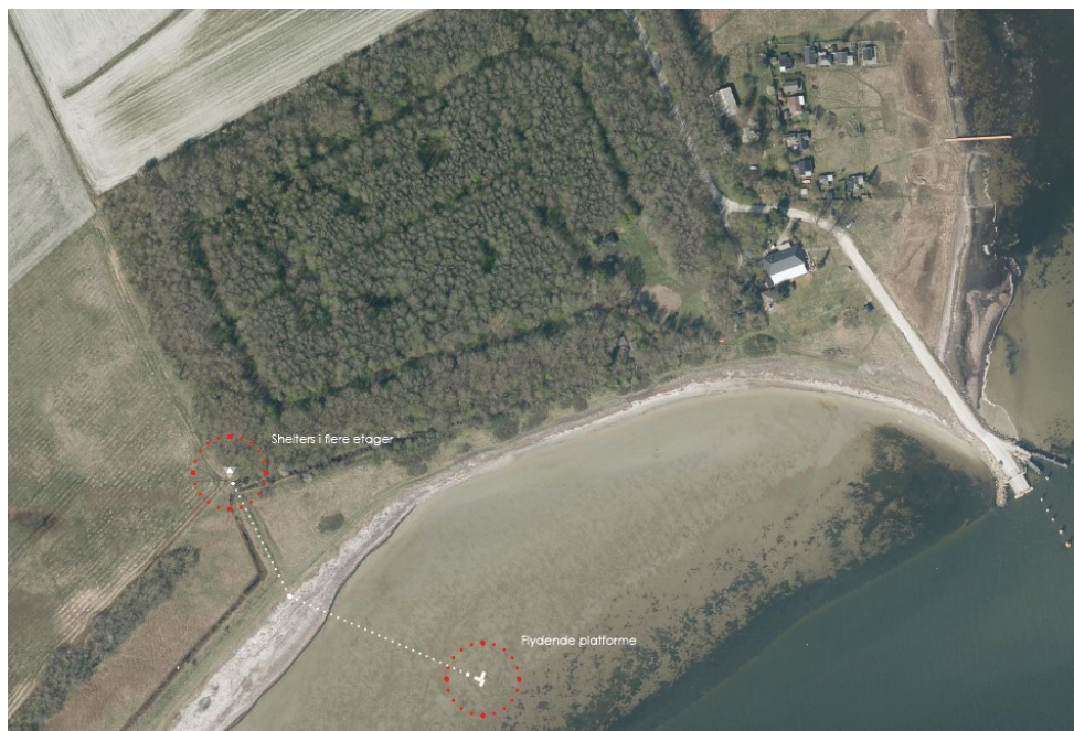
Figur 2, placering fra ansøgningen

Ansøgningen skal ses i forlængelse af tidligere ansøgning om tilladelse til at opføre hele anlægget med alle faciliteter på Limfjorden, altså på søterritoriet. Gennem dialogen har vi fået forståelse for, at overnatning på vand ikke er muligt, mens andre aktiviteter er mulige. Vi har studeret andre tilladelser til opførelse af sheltre inden for strandbeskyttelseslinien og har valgt en placering, der er inspireret af hidtidig praksis ligesom placeringen er mulig uden at konflikte med beskyttet natur.