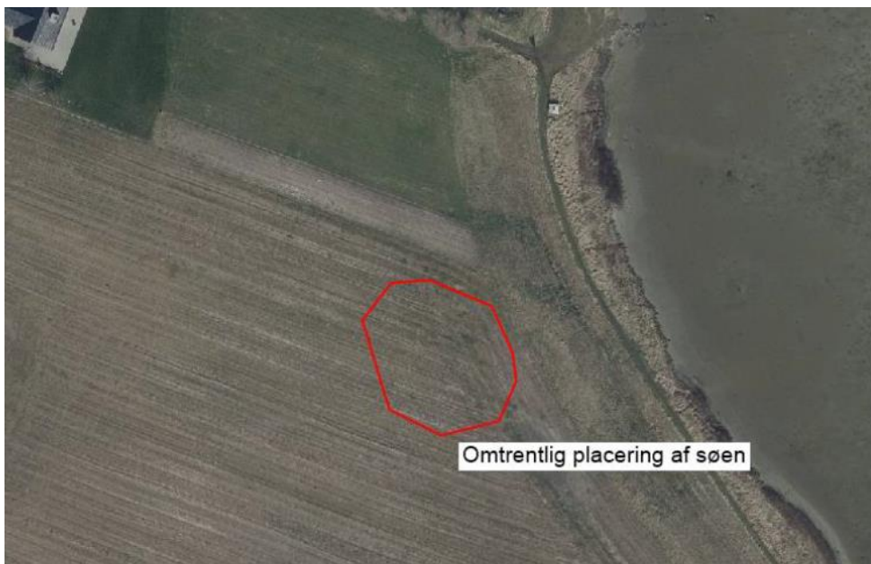
Fig. 2. Kort fra ansøgningen med den omtrentlige placering af den ansøgte sø.

Det fremgår af ansøgningen, at søen ikke bliver dybere end 1,5 m, samt at søen etableres med brinker der er svagt skrånende med en hældning på maks. 1:5, dvs. med et fald på maks. 20 cm pr. løbende meter.