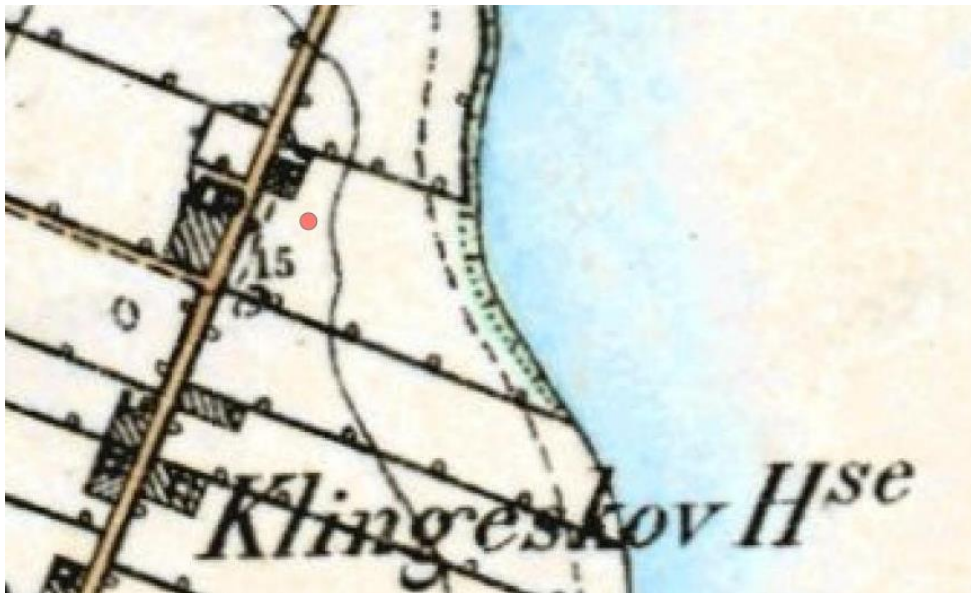
Fig. 3. Historisk baggrundskort, høje målebordsblade 1842-1899. Den røde prik markerer matriklen, hvor den søen ønskes etableret.

Kystdirektoratet har ud fra en gennemgang af ortofotos samt historiske baggrundskort vurderet, at der ikke tidligere har været en naturlig sø på den ansøgte placering (se fig. 3).