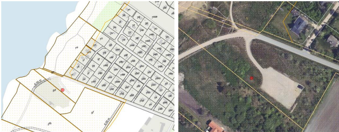
Figur 1. Den røde prik markerer matriklen og placeringen af det ansøgte madpakkehus. Det orange prikkede område markerer det strandbeskyttede areal. De umatrikulerede arealer ud til kysten samt stranden er dog også omfattet af bestemmelserne om strandbeskyttelse. De hvide streger markerer de vejledende matrikelskel.