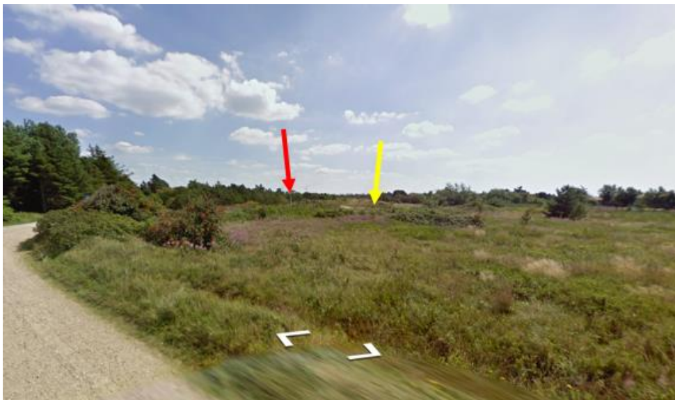
Figur 2. Kort fra google street view. Den røde pil markerer det eksisterende toilet. Den gule pil markerer den omtrentlige placering af det ansøgte madpakkehus.

Det fremgår af ansøgningen, at der ønskes opført et madpakkehus i tilknytning til en offentlig parkeringsplads, hvor der i forvejen er etableret en toiletbygning.