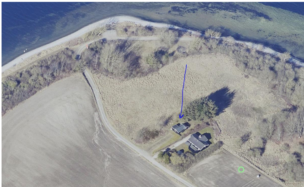
Ejendommen markeret med blå pil