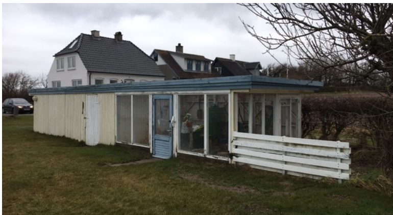
Eksisterende udhus – skur med udestue

Genopførelsen baseres på en carport som vist nedenfor på 21 m 2 , hvis sider tildækkes og der opføres i forlængelse heraf en udestue svarende til den eksisterende med en længde på ca. 5 m. Carportens tag forlænges over udestuen, således bygningen fremstår som en samlet enhed. Bygningens højde er ca. 2,20 m.