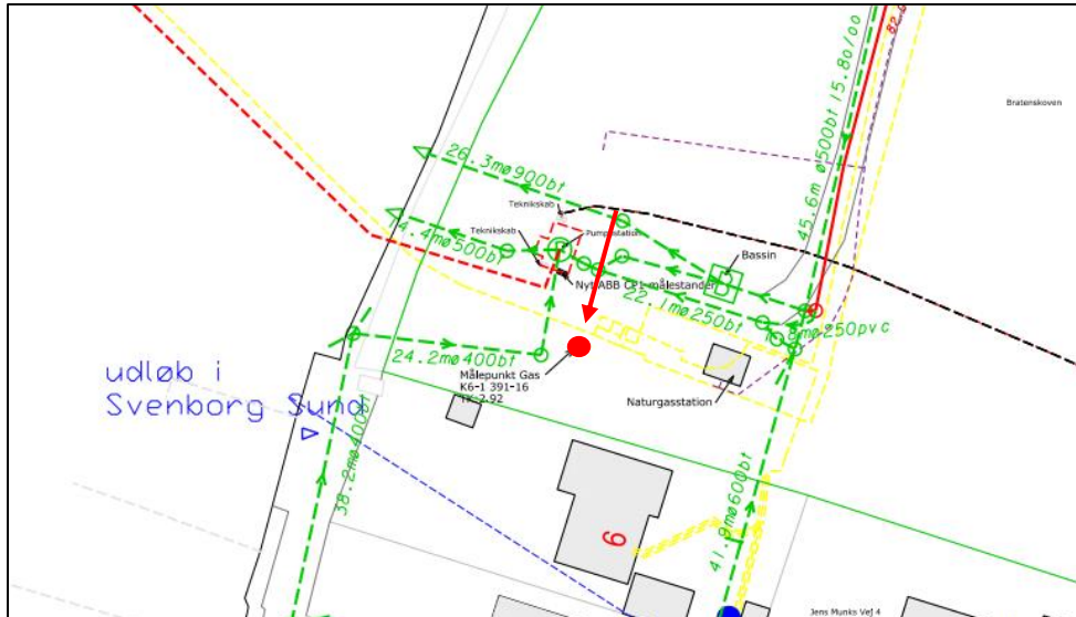
Figur 3. Skitse fra ansøgningen, der viser placering af målestandere på matr. 34b, Vindeby By, Bregninge (markeret med rød prik og pil)

Vand og Affald Svendborg har ved ansøgningen vedlagt bilag, der viser placering af de to målerstandere. Se figur 3-4.