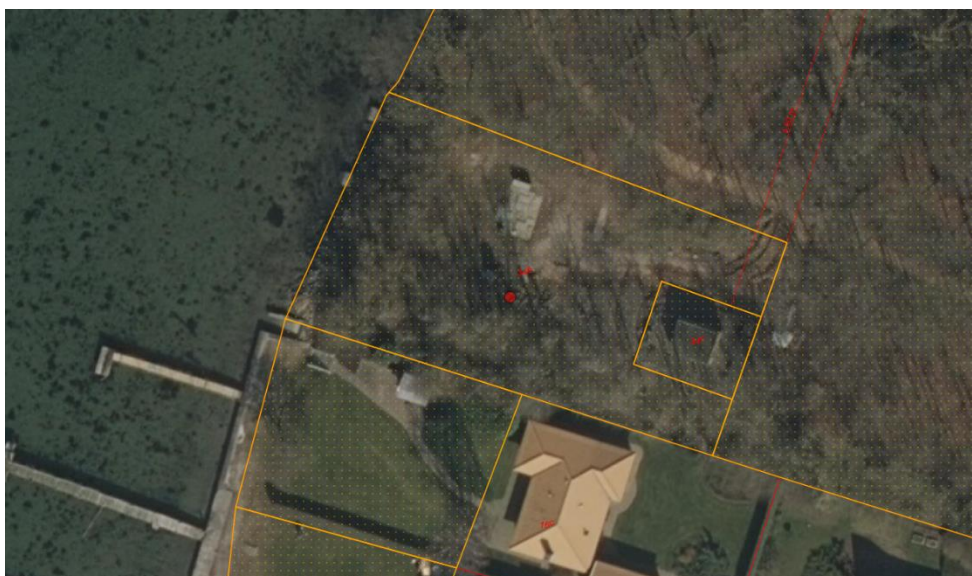
Fig. 1. Ortofoto (seneste). Matr. 34b, Vindeby By, Bregninge. Det orange prikkede område markerer det strandbeskyttede areal. De orange streger markerer de vejledende matrikelskel.

Der er brug for opsætning af 2 ABB CP1 målerstandere, da det nu er et lovkrav, at der skal etableres en særskilt katodisk beskyttelse af spildevandstrykledningen.