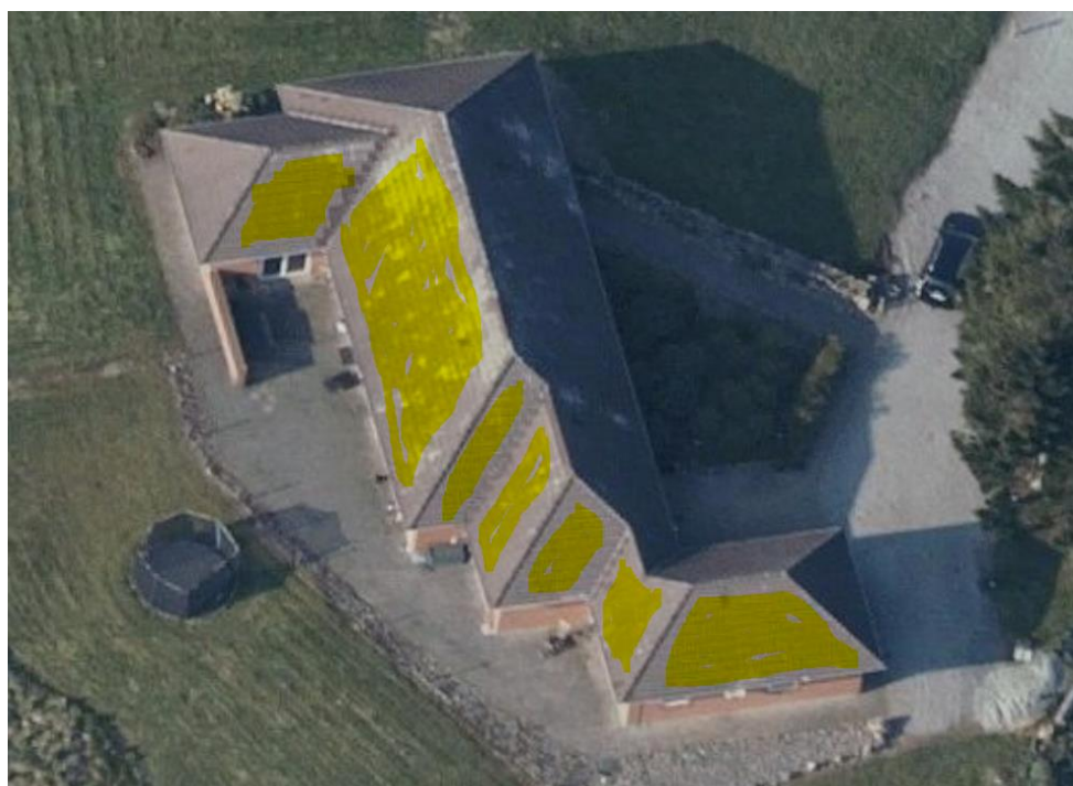
Tagflader markeret med gul hvor der monteres solcellepaneler

Panelerne placeres i flugt med / parallelt med tagfladen og således at panelernes overkant har en maksimalafstand fra taget på 12-15 cm, samt at panelerne placeres inden for tagfladens afgrænsning. De omhandlede tagflader er vist med gul markering på nedenstående luftfoto.