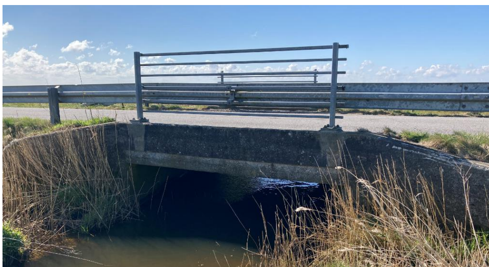
Fig. 2. Billede fra ansøgningen af den eksisterende bro.

Det oplyses, at anlægsarbejdet udføres fra vejarealet, og at der kun graves lige omkring broen for ikke at påvirke den beskyttede natur omkring broen.