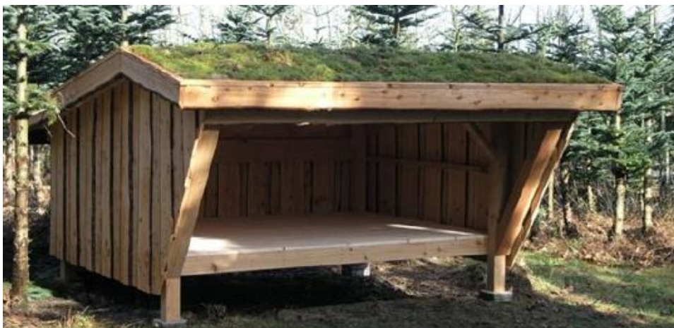
Fig. 2. Referencebillede af det ønskede shelter fra ansøgningen.

Det fremgår endvidere af ansøgningen, at det ansøgte shelter skal anvendes til fritidsovernatninger, samt at shelteret placeres så det ses mindst muligt fra naboer og skoven. Shelterets udvendige areal er på 11,9 m 2 . Højden på shelteret er ca. 1,9 m. Billede af det ansøgte shelter samt den præcise placering kan ses på fig. 2-3.