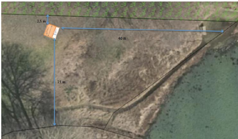
Fig. 3. Kort fra ansøgningen der viser placeringen af det ansøgte shelter.