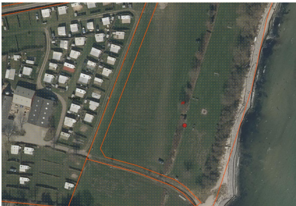
Fig. 1. Ortofoto (seneste). Det orange prikkede område markerer det strandbeskyttede areal. De røde streger markerer de vejledende matrikelskel. Den røde prik markerer den ønskede placering.

Tårup Landsbyråd oplyser, at matriklen er et offentlige areal ejet af Nyborg Kommune, der er placeret i tilslutning til den offentlige badestrand Kongshøj og beliggende øst for Kongshøj Strand Camping. Her er der offentlig adgang til vand, badebro og strand. Det er der mange som benytter sig at også i vintermånederne.