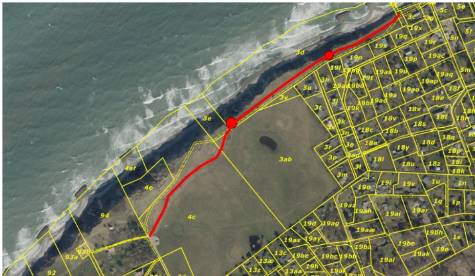
Fig. 1. Ortofoto fra ansøgningen. De gule streger markerer de vejledende matrikelskel. De røde prikker markerer de ønskede placeringer.

Halsnæs Kommune ønsker at opsætte af to bænke ved Spodsbjerg. Bænkene ønskes opsat langs stien, markeret med rød, der går gennem arealet, langs kysten. Placeringen af de nye bænke er markeret med rød cirkel, se figur 1.