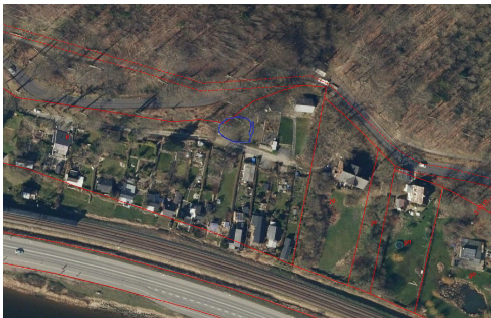
Blå markerer Skyttestien 52